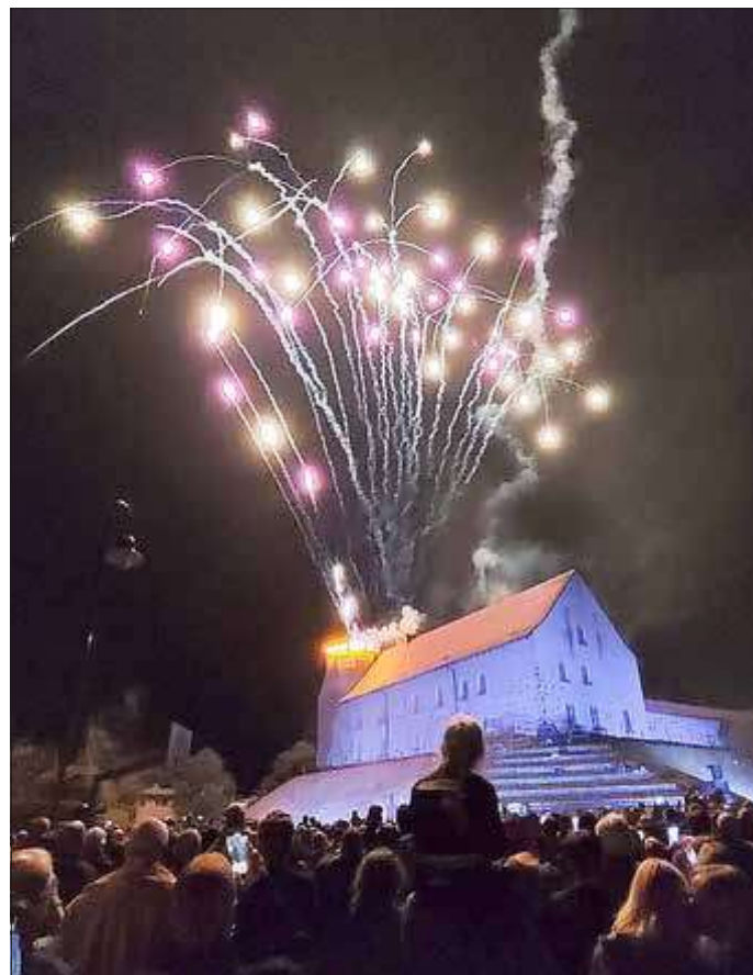
Wolfram Spieß Burgverein Wesenberg