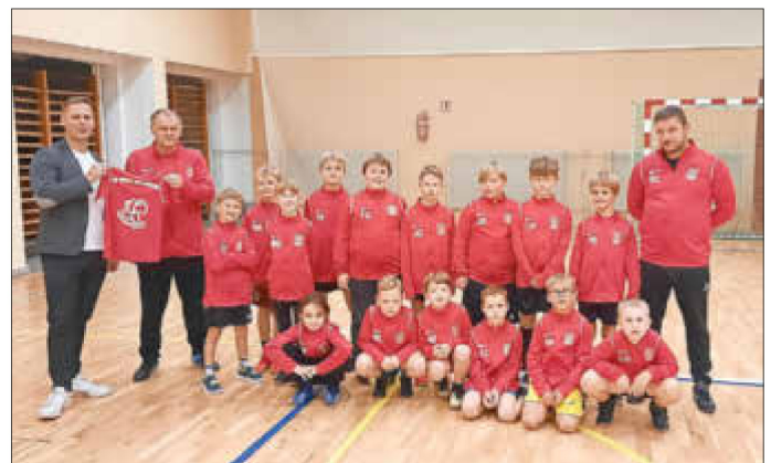
SV Union Wesenberg - Abteilung Fußball

Im Namen der Mannschaft gilt es auf diesem Wege auch noch einmal Danke an die Sommerrodelbahn in Burg Stargard für die Unterstützung zu sagen.