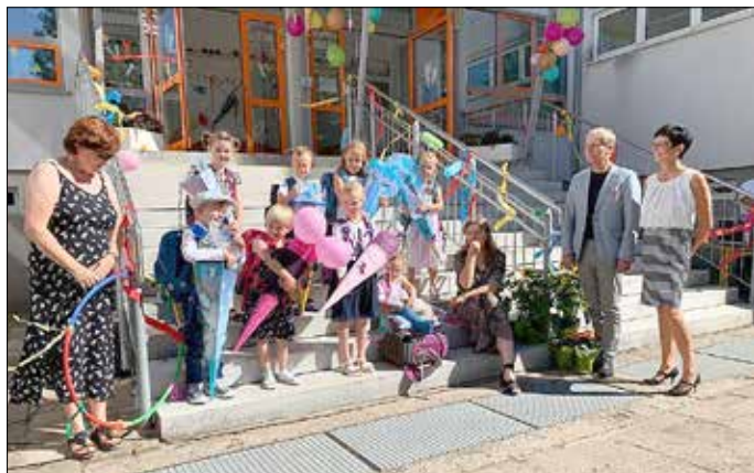
Schüler der Klassen 1a und 1b.