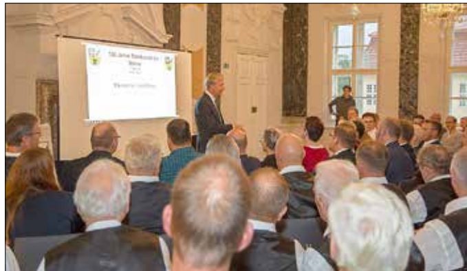
Bürgermeister Henry Tesch während der Festveranstaltung am 01. Oktober 2019 im Mirower Schloss. Hier hat er u. a. den Wettbewerb angeregt und ihn in der Folge initiiert.