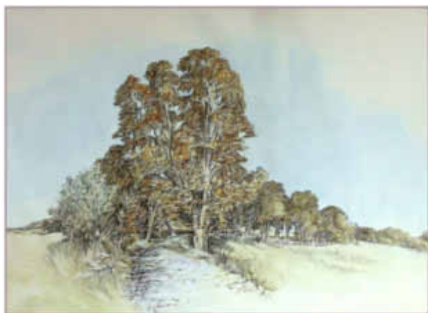
Historischer Alleenabschnitt in der Mecklenburgischen Seengebiet

Veranstaltung zum Jubiläum 25 Jahre Deutsche Alleenstraße am Tag des Offenen Denkmals und im mecklenburgischen Kulturherbst am Sonntag, dem 10. September 2017